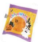
ハロウィン米粉のカップケーキ(鉄) 25g ヤヨイサンフーズ

米粉のしっとりした口当たりと、かぼちゃの風味が香る生地、糖蜜漬けたかぼちゃをトッピングして焼き上げたカップケーキです。かわいらしいハロウィン限定デザインの包装でお届けします。鉄分豊富