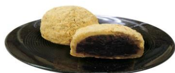
冷凍おはぎ(きなこ) 400g(10個入) ジェフダ

国内産 100%のもち米を甘さ控えめの餡で包みました。昔ながらの味わいが楽しめるおはぎです。