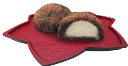
冷凍おはぎ(粒あん) 400g(10個入) ジェフダ

国内産 100%のもち米を甘さ控えめの餡で包みました。昔ながらの味わいが楽しめるおはぎです。